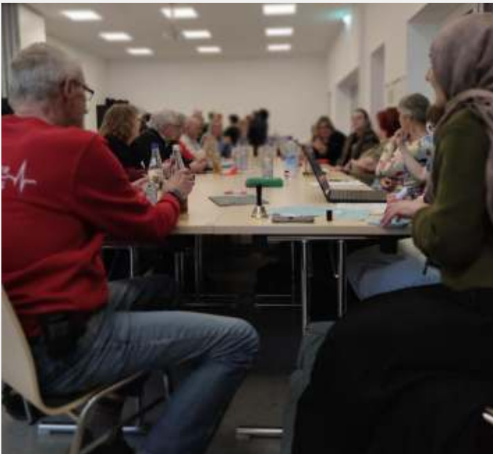
Teilnehmerinnen und Teilnehmer der Zukunftswerkstatt „Ehrenamt neu denken“ im Landkreis Mühldorf tauschen sich aktiv über die Zukunft des Ehrenamts aus und entwickeln gemeinsam neue Ideen für ein zukunftsfähiges Engagement.

Wer über die Maßnahmen aus der Zukunftswerkstatt sowie weitere Veranstaltungen des Freiwilligenzentrums informiert werden möchte, schreibt an freiwilligenzentrum@lra-mue.de .