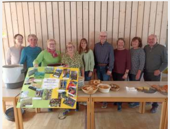
Text und Bild: Margit Tafelmeier

Gerne begrüßen wir neue Interessierte in unserer Runde und freuen uns auf weiterhin erfolgreiche Projekte.