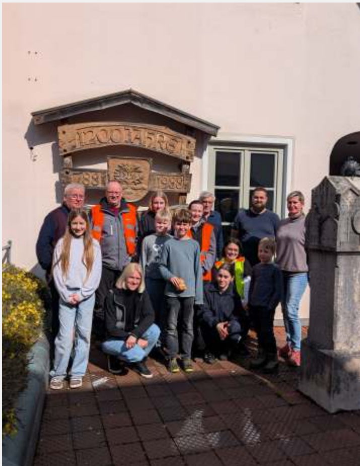
Text und Bild: Renate Bruckmaier

Für die Zukunft wäre es wünschenswert, dass diese Aktion mehr Anklang bei den Bürgerinnen und Bürgern findet, dadurch müssten nicht so weite Strecken zurückgelegt werden und man käme zu einem schnellerem Ende.