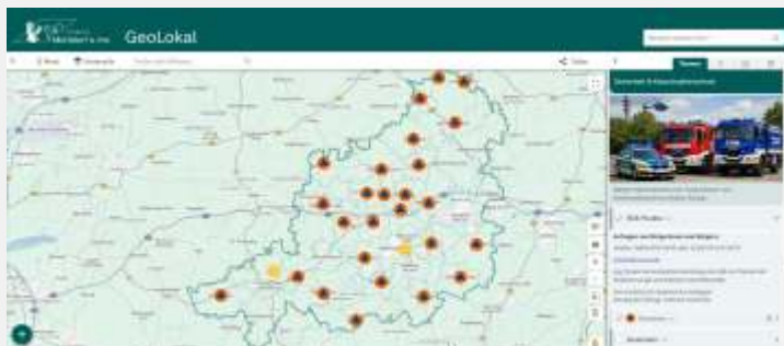
In dem Online-Portal GeoLokal des Landkreises sind die SOS-Punkte in den Gemeinden mit dem Zivilschutz-Zeichen gekennzeichnet.

Die aktuellen Maßnahmen sollen deshalb Orientierung geben, Sicherheit schaffen und die Bevölkerung dazu ermutigen, sich bewusst mit möglichen Krisensituationen auseinanderzusetzen."