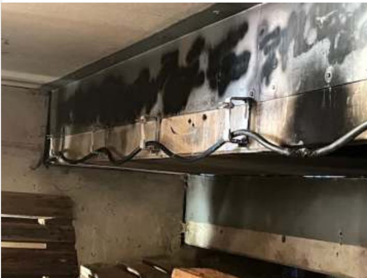
Text und Bild: Christian Schubert

Wenn jemand etwas im Bereich der Rückseite der Tribüne gesehen hat, oder wenn jemand sachdienliche Hinweise zu dem Täter / den Tätern benennen kann, bittet der TSV Buchbach um kurze Mitteilung an ghanslmaier@tsv-buchbach.de . Der Hinweis kann auch anonym abgegeben werden.