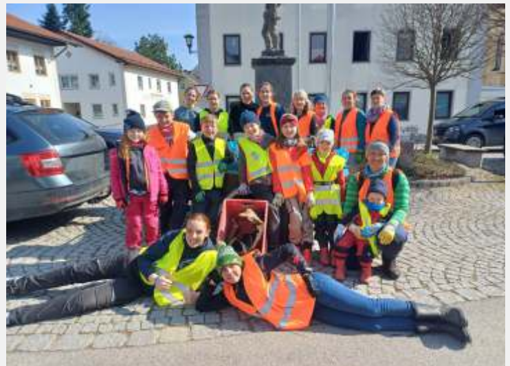
Die Teilnehmer nach der erfolgreichen Säuberungsaktion in Ranoldsberg

Die Ranoldsberger Ministranten, viele Kinder sowie weitere freiwillige Helfer fanden sich auch in diesem Frühjahr in Ranoldsberg zum „Ramma damma“ in und um den Ort ein. In Gruppen eingeteilt, strömten die Kinder und Erwachsenen aus, um den Ort und die Umgebung im gesamten Pfarreibereich von Unrat zu säubern. Die Freiwilligen waren mit Feuereifer bei der Sache und hatten dabei auch noch Spaß. Im Ergebnis stand ein großer Anhänger voller Müll. Neben unachtsam weggeworfenen Dosen und Verpackungen von Fastfood waren auch sehr viele Flaschen, Zigarettenschachteln und Kaffeebecher die aufgesammelt wurden. Den Kinder wurde bei der Aktion eindringlich ins Bewusstsein geführt, was so alles im Straßengraben und im Wald entsorgt wird, obwohl für sämtliche Abfälle eine reguläre Entsorgung geregelt und möglich ist. Als Belohnung für den vorbildlichen Einsatz der fleißigen Müllsammler wurden die Teilnehmer vom Markt Buchbach auf eine Brotzeit eingeladen, welche sich die Helfer munden ließen.