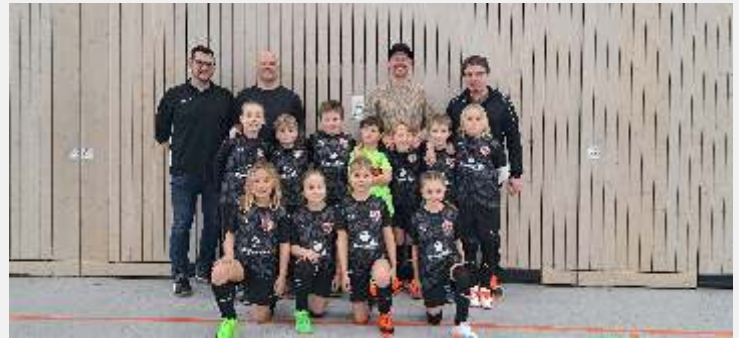
Text und Foto: Max Hofstetter

Die F-Jugend des TSV Buchbach bedankt sich herzlich für die großzügige Unterstützung und hofft nun auf eine erfolgreiche Zeit – sowie auf viele neue Nachwuchskicker, die Begeisterung für den Fußball teilen.