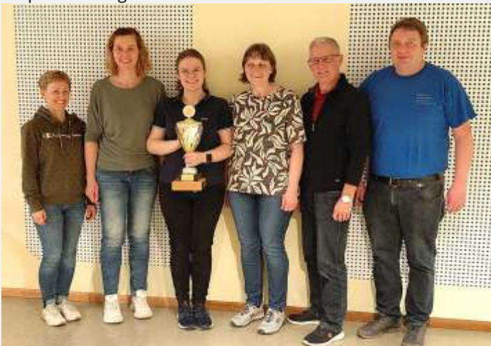
Text und Foto: Franz Rampf

Schützenmeister Franz Schmid dankte zum Schluss allen Teilnehmern für den fairen Wettkampf und der sichtbaren Freude am Schießsport mit dem Luftgewehr und der Luftpistole. Bis spät in die Nacht feierten die Teilnehmer ihre Siege und Ergebnisse, aber auch die Enttäuschung über den verpassten Sieg.