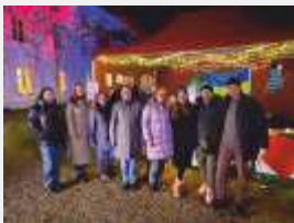
Enge Zusammenarbeit der beiden Vereine vor Ort in Zangberg, wie zuletzt beim Adventsmarkt