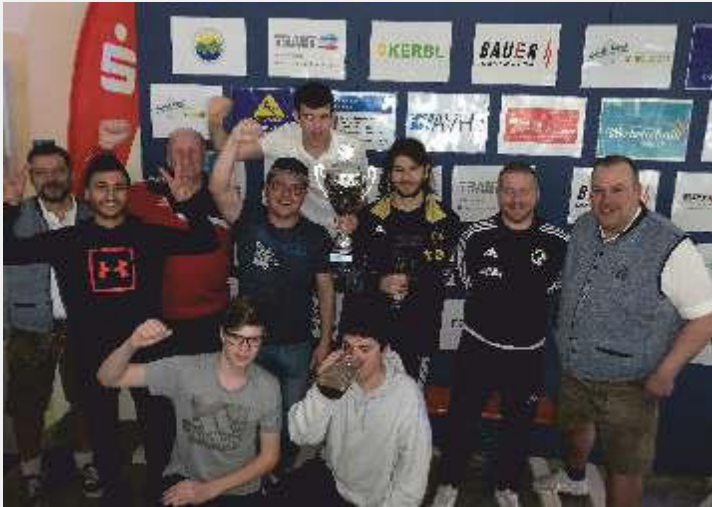
7. El Coronitas Hallencup Sieger Dreamteam Holzhausen