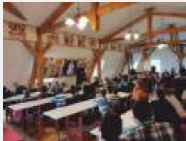
Unterstützung bei Erweiterung einer Sonntagsschule in Uschhorod für ukrainische Binnenflüchtlinge

Im Rahmen des Regionalligaspiels des TSV Buchbach gegen Wacker Burghausen am Samstag, 04. März 2023 , besteht nun die Möglichkeit, sich über die Arbeit der beiden Vereine zu informieren. Bei dieser Gelegenheit werden am gemeinsamen Informations- und Verkaufsstand auch ukrainische Spezialitäten angeboten, unter anderem die erst kürzlich zum Weltkulturerbe ernannte ukrainische Nationalsuppe „Borschtsch“. Kommen Sie zu uns an den Stand, wir beantworten gern Ihre Fragen!