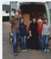
Organisation von regelmäßigen Hilfslieferungen in Zusammenarbeit mit den Missionsschwestern vom Heiligsten Erlöser aus Unterreit