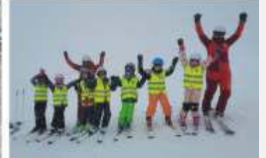
Teilnehmer der Skikurse