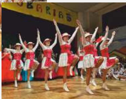
Text und Bilder: Thomas Esser