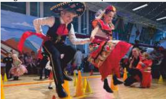
Das Kinderprinzenpaar beim spielen.