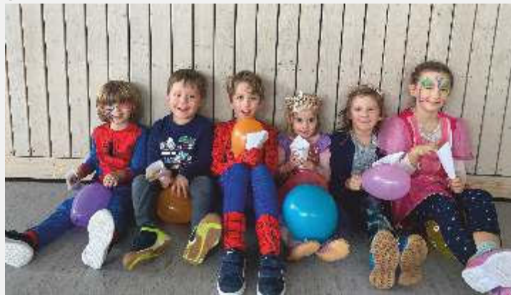
Text und Bild: Daniela Behrendt

Die besondere Tennisstunde im Fasching bereitete den Kindern viel Freude und hat darüber hinaus sehr viel Spaß gemacht.