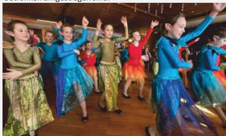
Die Gruppe „Zuckerpuppen“ des TSV Grüntegernbach

Die Bubarinis in ihren Papageienkostümen rundeten dann die Veranstaltung ab, während der die Gäste inzwischen von Kaffee und Kuchen auf herzhafteres mit den dazu passen Getränken umgestiegen sind.