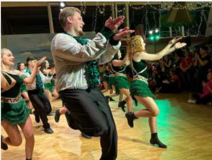
Die Prinzengarde „in action“.