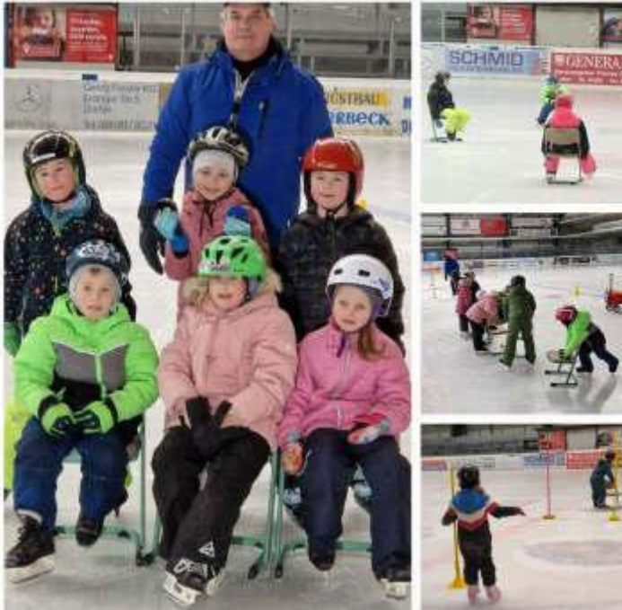
Text und Bilder: Michaela Lehmeier, Nicole Thalmeier und Lisa Voith