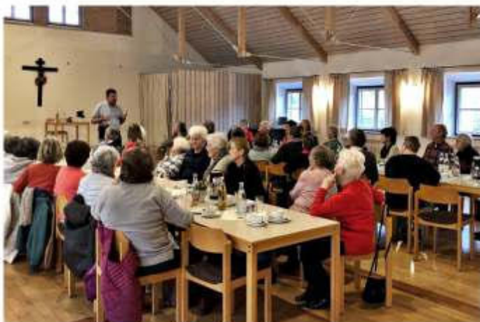
Text und Bild: Johann Swist