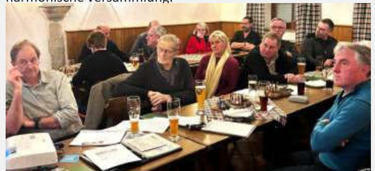
Text und Bild: Franz Rampl

Mit der Vorschau auf die anstehenden Termine, sowie einem Dank an die Mitglieder, beendete Vorstand Stoiber die harmonische Versammlung.