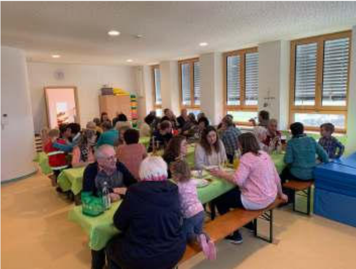
Text und Bilder: Janine Wimmer