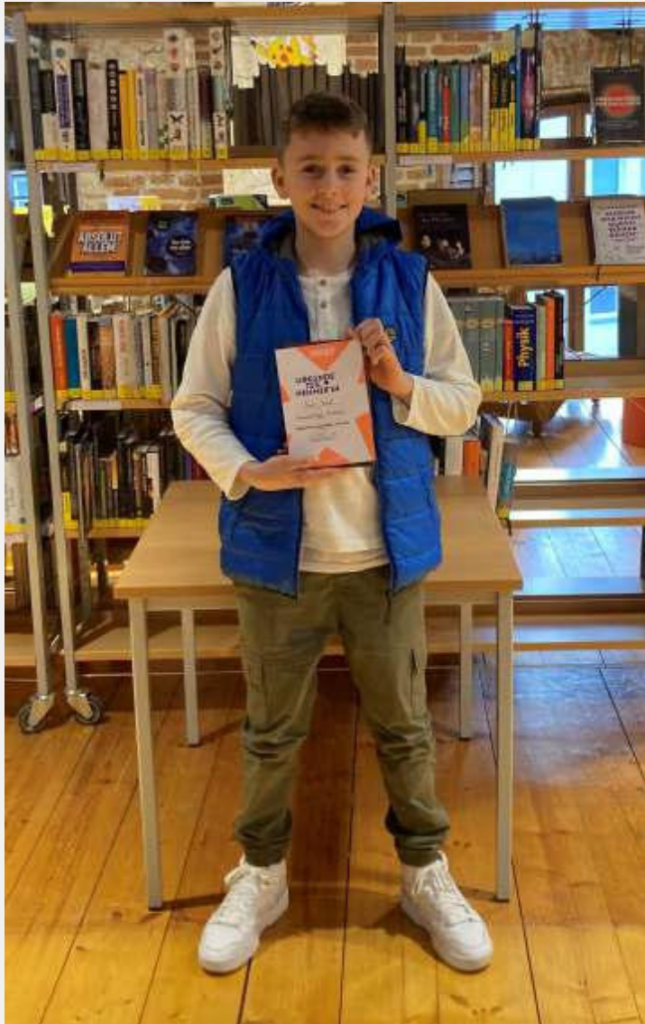
Text und Bild: Katharina Vogel

Es war beeindruckend zu sehen, wie engagiert und talentiert die jungen Leserinnen und Leser waren. Der Vorlesewettbewerb war ein voller Erfolg und zeigte einmal mehr, wie wichtig Lesen für junge Menschen ist.