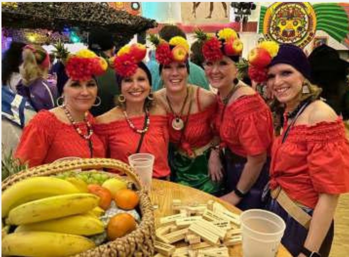
Die „Fruchtigen Fünf“ aus Buchbach.

Auch am Faschingsdienstag wurde dann am Marktplatz in Buchbach noch einmal ordentlich gefeiert und wer die Auftritte der Gruppen bislang noch nicht gesehen hatte, bekam hier noch einmal die Gelegenheit dazu. Mit dem traditionellen Verbrenne des Faschings fand der Fasching 2024 damit seinen krönenden Abschluss.