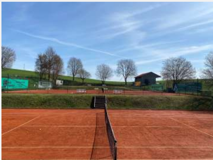
Text und Bild: Daniela Behrendt

Wir wünschen allen Spielern eine schöne, erfolgreiche und vor allem eine verletzungsfreie Saison.