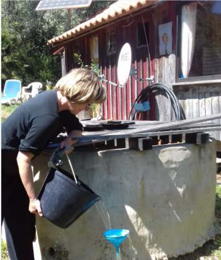
Text und Bild: Irina Borisow

05. Mai 2022, 18 Uhr , Gasthaus Zum Falken, Buchbach, Teilnahmegebühr 8 Euro, max. Teilnehmerzahl 20 Pers., Anmeldung erwünscht unter Tel. 0170/7473561.