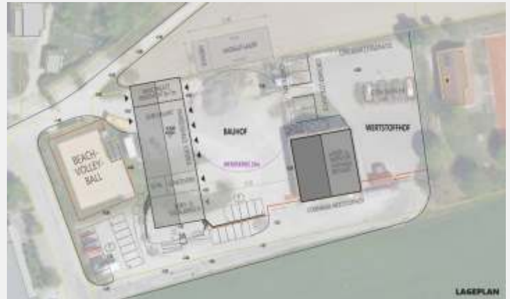
Lageplan mit Bauhof Variante West

Die Verwaltung wurde beauftragt, dazu entsprechende Planungsleistungen zu beauftragen und einen Förderantrag zu stellen.