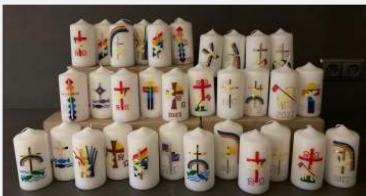
Text und Bild: Teresa Ramsauer

Am Morgen des 07.05.2022 werden die Altkleidersäcke an den Sammelstationen eingesammelt und nach Ampfing gebracht, wo diese dann weiter verladen werden. Die gesammelte Kleidung kommen hilfsbedürftige Menschen im Ausland zu gute.