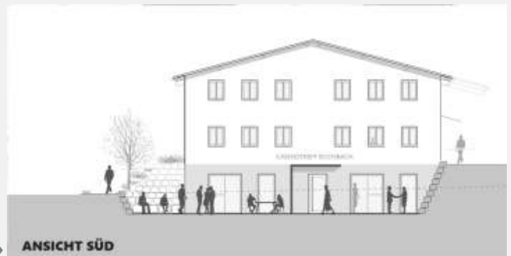
Ansicht Bauhof mit Jugendtreff