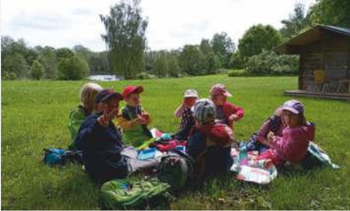
Text und Bilder: Daniela Behrendt

Beim Loaner Weiher angekommen, wird die Picknickdecke ausgebreitet und gemeinsam gegessen. Die Brotzeit schmeckt nach der Wanderung immer besonders gut. Nach der Stärkung dürfen sich die Kinder am Spielplatz austoben bis sie von ihren Eltern dort abgeholt werden.