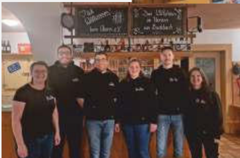
Text: Robert Kurz