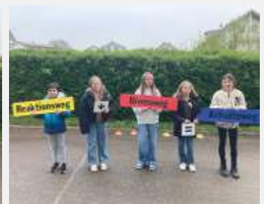
Text: Dr. Dörr