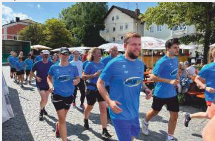
Starter beim „LAUF10!“ in Buchbach

Ein wesentlicher Programmpunkt war das Finale des „LAUF10!“-Rennens. Für diesen Wettkampf, der vor vielen Jahren vom Leichtathletik-Verband ins Leben gerufen wurde, hatten sich die Teilnehmer 10 Wochen lang vorbereitet. Gemäß der Idee „Jeder nach seinem Tempo, jeder nach seinem Geschmack“ machten sich 35 Teilnehmerinnen und Teilnehmer entweder als Nordic-Walker oder als Läufer auf die 10 Kilometer lange Strecke, die sie alle super meisterten. Wer hierzu jetzt Lust verspürt und auch etwas für seine Gesundheit machen möchte, kann jederzeit beim offenen Walk- und Lauftreff des TSV mitmachen. Rundherum ein toll organisierter und perfekt verlaufener Tag, der mit einem reichhaltigen Kuchenbuffet, einer Sau vom Grill, einer gemütlichen Weinlaube und Spezialitäten aus Südtirol sowie kühlem Bier und alkoholfreien Getränken mit musikalischer Unterstützung der „Best Off“ aus Landshut vielen Feiernden lange im Gedächtnis bleiben wird.