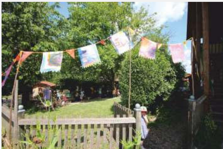
Text und Bild: Daniela Behrendt

Es war ein wunderschönes Sommerfest in entspannter Atmosphäre. Herzlichen Dank an unsere Eltern, die so tatkräftig zum Gelingen beigetragen haben.