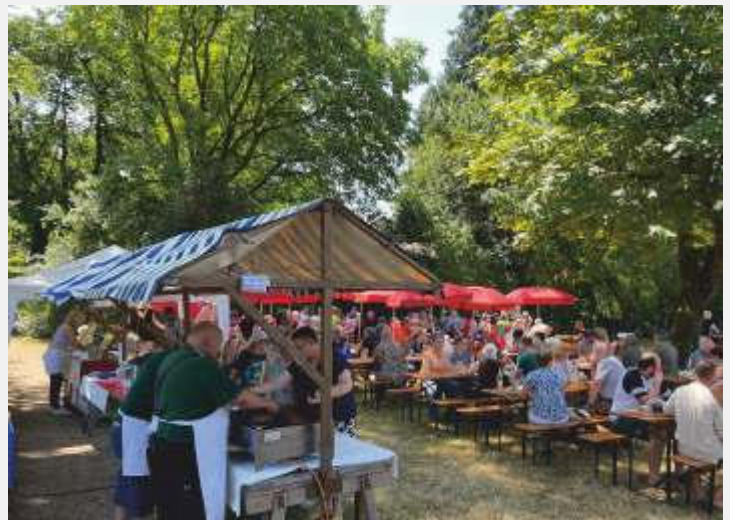
Fischerfest in Buchbach am Badeweierpark