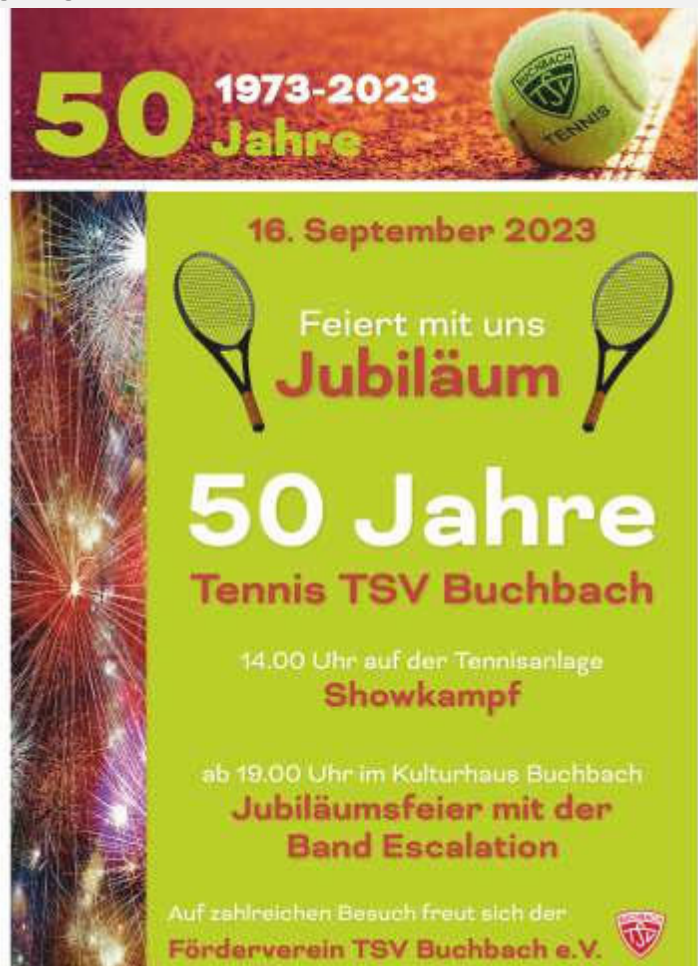
Text, Bild und Flyer: Daniela Behrendt

Der Eintritt ist frei und für das leibliche Wohl wird bestens gesorgt.