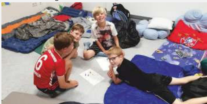
Text und Bilder: Alexandra Hofer

Fast unbemerkt war es 24 Uhr geworden. Es war an der Zeit, sich bettfertig zu machen! Alle Kinder putzten sich die Zähne und zogen sich die Schlafanzüge an. Schnell schlüpfen sie in ihre Schlafsäcke, um noch kurz mit der Taschenlampe in ihren Lieblingsbüchern zu schmökern, bevor die Bettruhe begann. Am nächsten Tag beendeten die Klassen mit einem gesunden Frühstück die Lesenacht und hatten am Wochenende zu Hause eine Menge zu erzählen.