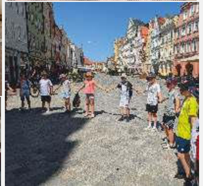
Text und Bilder: Alexandra Hofer