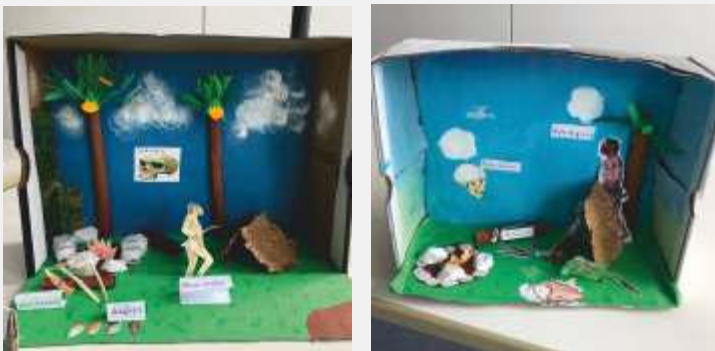
Text und Bilder: L. Rudolph

Dieses Projekt zeigt eindrucksvoll, wie interdisziplinärer Unterricht und kreative Methoden das Interesse der Schülerinnen und Schüler wecken und vertiefte Lernerfahrungen ermöglichen können.