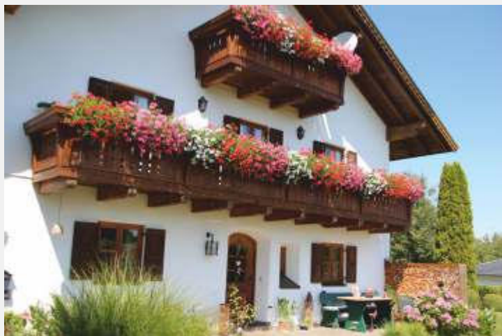
Ein blumengeschmücktes Bauernhaus