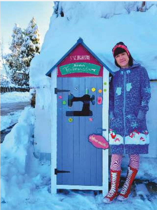
Text und Bild: Kristin Rauscheder