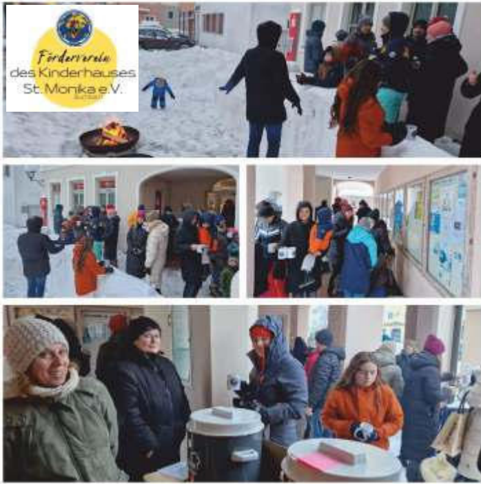
Besucher und Helfer an der Schneebau

Trotz des vielen Schnees und der Verschiebung des Christkindlmarktes, von 2. Dezember auf den 10. Dezember, ließen sich der Elternbeirat und der Förderverein des Kinderhauses St. Monika nicht unterkriegen. Kurzerhand wurde die Wetterlage zum Besten genutzt und eine Schneebau neben dem Rathaus errichtet. Ab 15 Uhr gab es unter den Arkaden des Rathauses selbstgemachte Adventskränze, gebastelte Weihnachtsdekoration, Glühwein und einiges mehr zu kaufen.