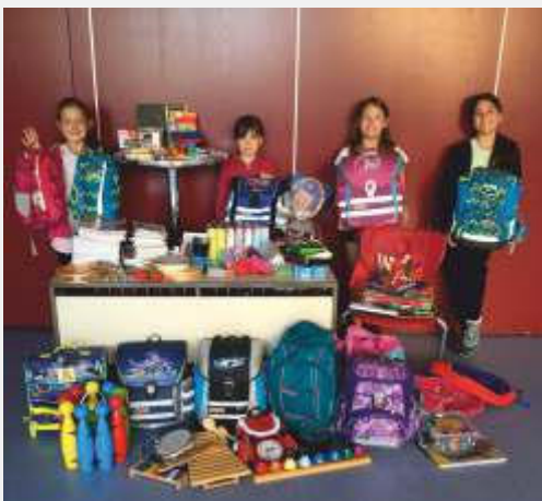
Text und Bild: Regina Waldinger

DANKE an alle, die diese Aktion mit ihren Spenden unterstützt haben!