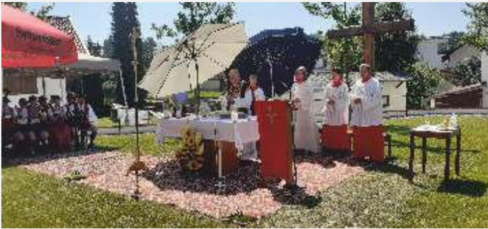
Text und Bild: Martha Oberwallner

Nach der Weihe wurden vom Pfarrgemeinderat Getränke gereicht, so kamm es noch zu netten Gesprächen. Somit war es ein gelungene Weihe.