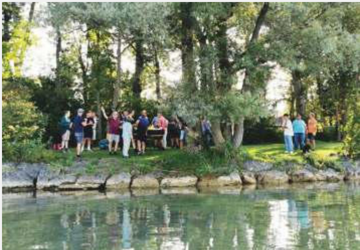
Eine kleine Brotzeitpause am Chiemsee