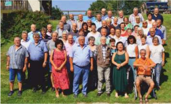
Text und Bild: Anton Maier