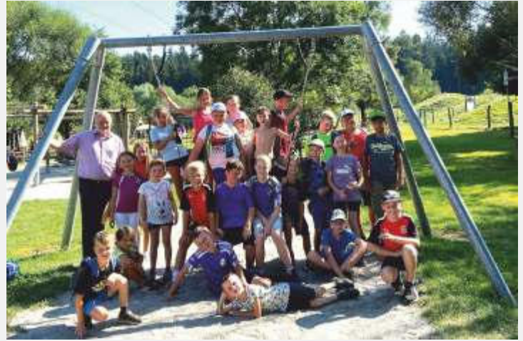
Bürgermeister Thomas Einwang mit Ferienkindern